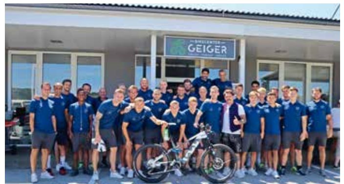
Der Fußballverein WAC hat sich während seines Trainingslagers Räder ausgeborgt.