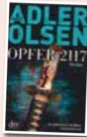
Jussi Adler-Olsen Opfer 2117

Der 8. Fall für Carl Mørck und dem Sonderdezernat Q. Auf Zypern wird eine alte Frau aus dem Nahen Osten aus dem Wasser gezogen. Auf der „Tafel der Schande“ in Barcelona, ist sie Opfer 2117. Doch die alte Frau ist nicht ertrunken, sie wurde ermordet.