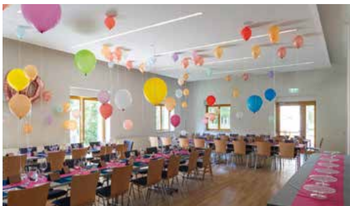
Der Saal steht für Feiern jeglicher Art zur Verfügung.