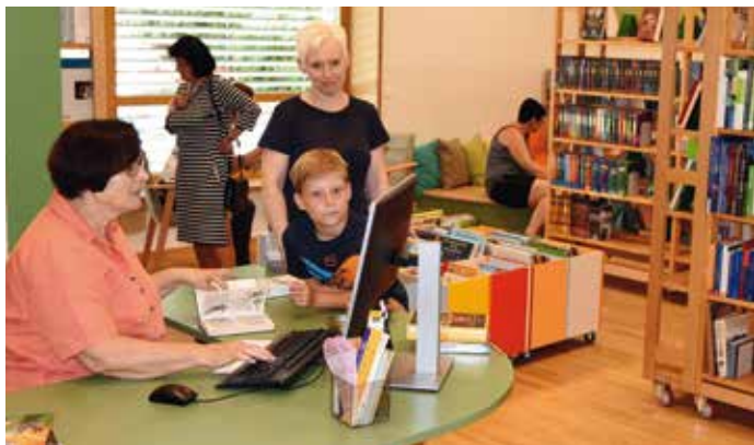
Im neuen Pfarr-Gemeinde-Haus ist auch die Bücherei untergebracht.