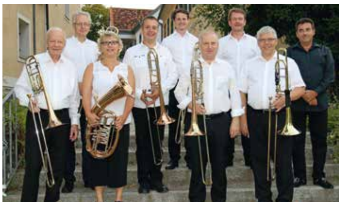
Bad Waltersdorf war „Posaunisten-Hochburg“.