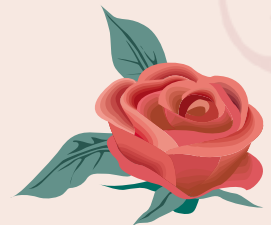
Theresia Strahlhofer 90 Jahre, Sebersdorfberg