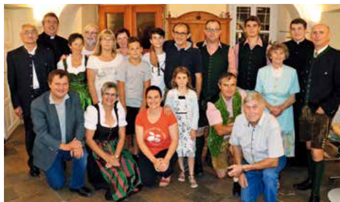
Familie Toberer und einiger Helfer luden zur Agape.