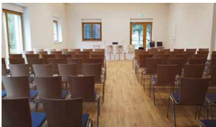
Vorträge oder auch standesamtliche Trauungen (wie im Bild) können dort stattfinden.