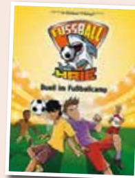
Andreas Schlüter Die Fußball-Haie – Duell im Fußballcamp

Connis beste Freundin Lena gewinnt VIP-Tickets für das Spiderfish-Festival. Das ist das größte Musikfestival im Umkreis. 5 Freundinnen, 5 Tickets! Die Freundinnen sind sich sicher: Das wird das Ereignis des Jahres!