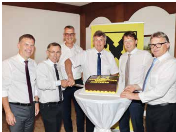
Mit einer Hochzeitstorte wurde die Verschmelzung der Raiffeisenbank Hartberg und der Raiffeisenbank Thermenland gefeiert.