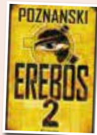
Ursula Poznanski Erebus 2

In fünf Einzelgeschichten wird von fünf Frauen erzählt – sie heißen Paula, Judith, Brida, Malika und Jorinde, die auf die eine oder andere Weise miteinander verbunden sind, als Freundinnen, Schwestern oder als Rivalinnen in der Liebe.