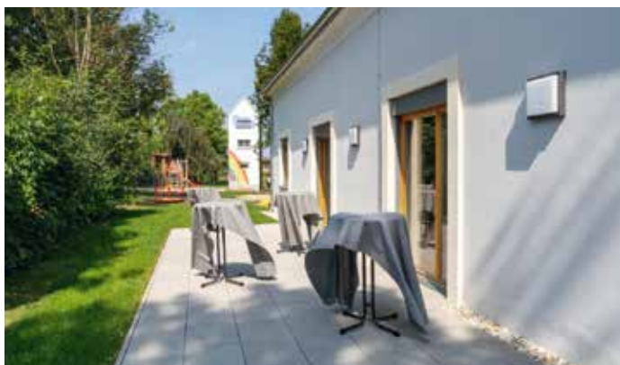
Auch die Terrasse kann mitbenutzt werden.