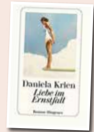
Daniela Krien Liebe im Ernstfall

Der 8. Fall für Carl Mørck und dem Sonderdezernat Q. Auf Zypern wird eine alte Frau aus dem Nahen Osten aus dem Wasser gezogen. Auf der „Tafel der Schande“ in Barcelona, ist sie Opfer 2117. Doch die alte Frau ist nicht ertrunken, sie wurde ermordet.