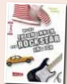
Dagmar Hoßfeld Conni - Meine Freundinnen, der Rockstar und ich

Als Nick auf seinem Smartphone ein vertrautes Icon in Gestalt eines roten E entdeckt, glaubt er zuerst an einen Zufall. Aber dann wird ihm klar: Erebus hat ihn wiedergefunden. Eine Mischung aus Jugendbuch, Thriller und Computerspiel.